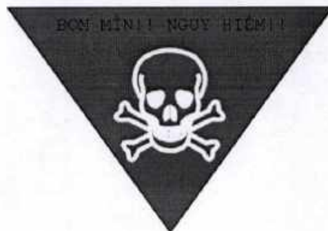
Hình D.1 - Biển báo vật liệu nổ hình vuông